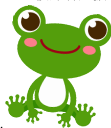
イメージキャラクター かえるちゃん

産育休中のみなさんお元気でお過ごしですか？ しばらく職場から離れているみなさんにとっては、新しい職場環境に復帰するにあたり、不安や戸惑いの気持ちをお持ちのことと思います。 このかえるちゃん通信を通して、そういうみなさんに、病院からの情報等を定期的にお届けします。今回は看護部長からのメッセージをお届けします。