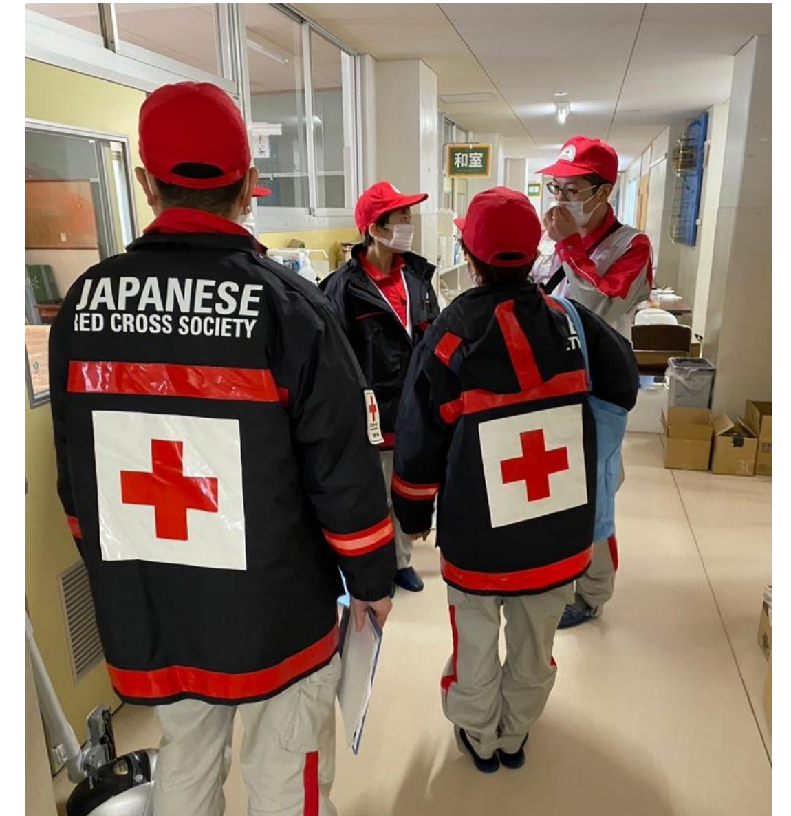
チームで避難所をアセスメントする様子

当院救護班は七尾市を中心に能登半島南部～中部を中心に活動させて頂きました。震源から少し離れるものの建物や道路の損壊は至る所で見られ、活動本部では避難所の状況把握が進まない状況でした。そこで救護班を派遣し避難所の状況把握をメインミッションとして行なっており、当院救護班は避難所活動と本部活動を担わせていただきました。5日は避難所の状況把握は6%でしたが、多くの救護班との協働により8日には50%を超える状況となりました。そのため活動中盤からは避難所の巡回診療や物資の搬送も実施させて頂きました。早朝から夜間までの活動であったため、宿泊先のスタッフに会うことは初日だけでしたが、最終日には写真のようなメモを頂き、現地の方に励まされてしまいました。次班はさらに北部の厳しい環境での活動が予測されるため帰院後も入念にチーム間の引き継ぎを行い活動を終了しました。